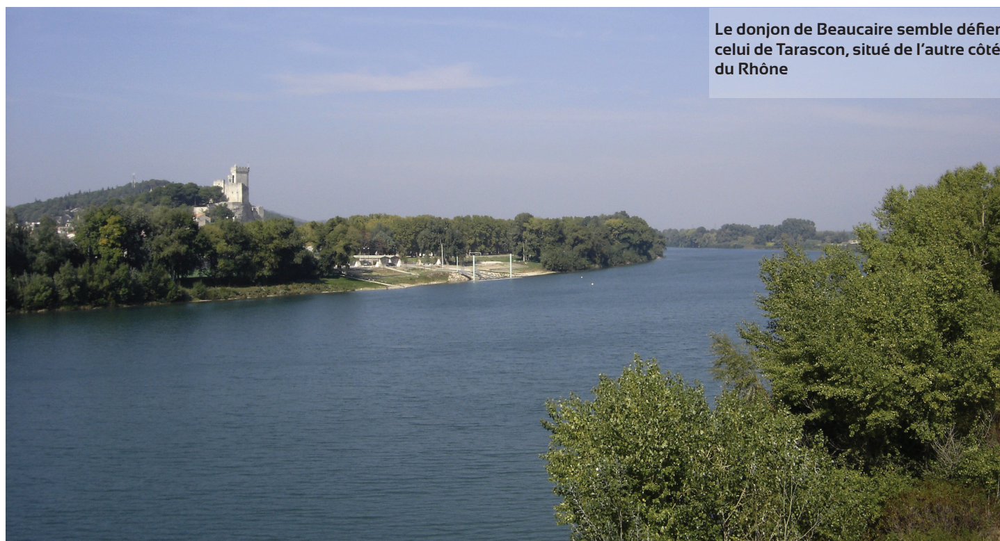
Le donjon de Beaucaire semble défier celui de Tarascon, situé de l'autre côté du Rhône